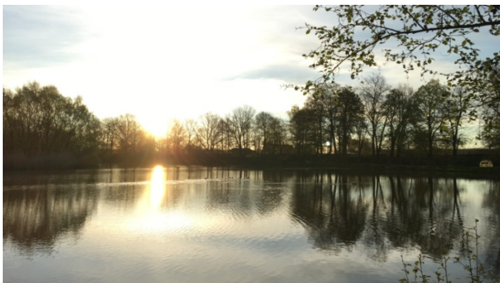
Verze ze 4. 5. 2021: Mlha se zvedá nad rybníkem ....