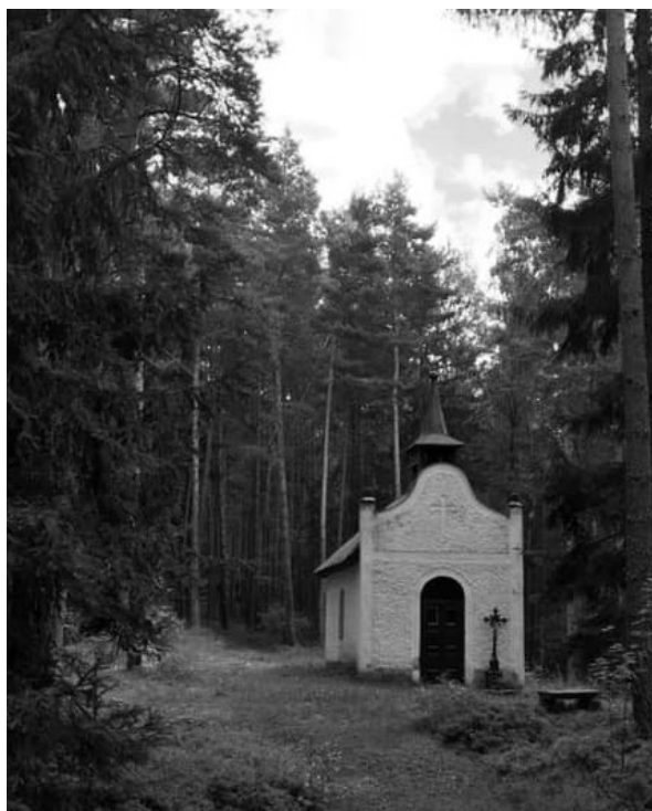
(Kaple Panny Marie Pomocné nad Kašperskými Horami)